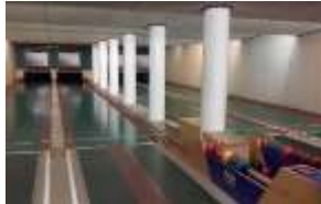
Wunsiedel, Hotel Wunsiedler Hof, Jean-Paul-Straße 2

Wörterbuch: Kegeln, das; Wortart: Substantiv Lautschrift: [ke:ɡl̩n]