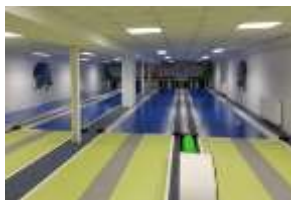
Warmensteinach, Sportplatzweg 139

Wir „pilgern“ zu den Kegelbahnen Wunsiedel, Goldkronach und Warmensteinach.